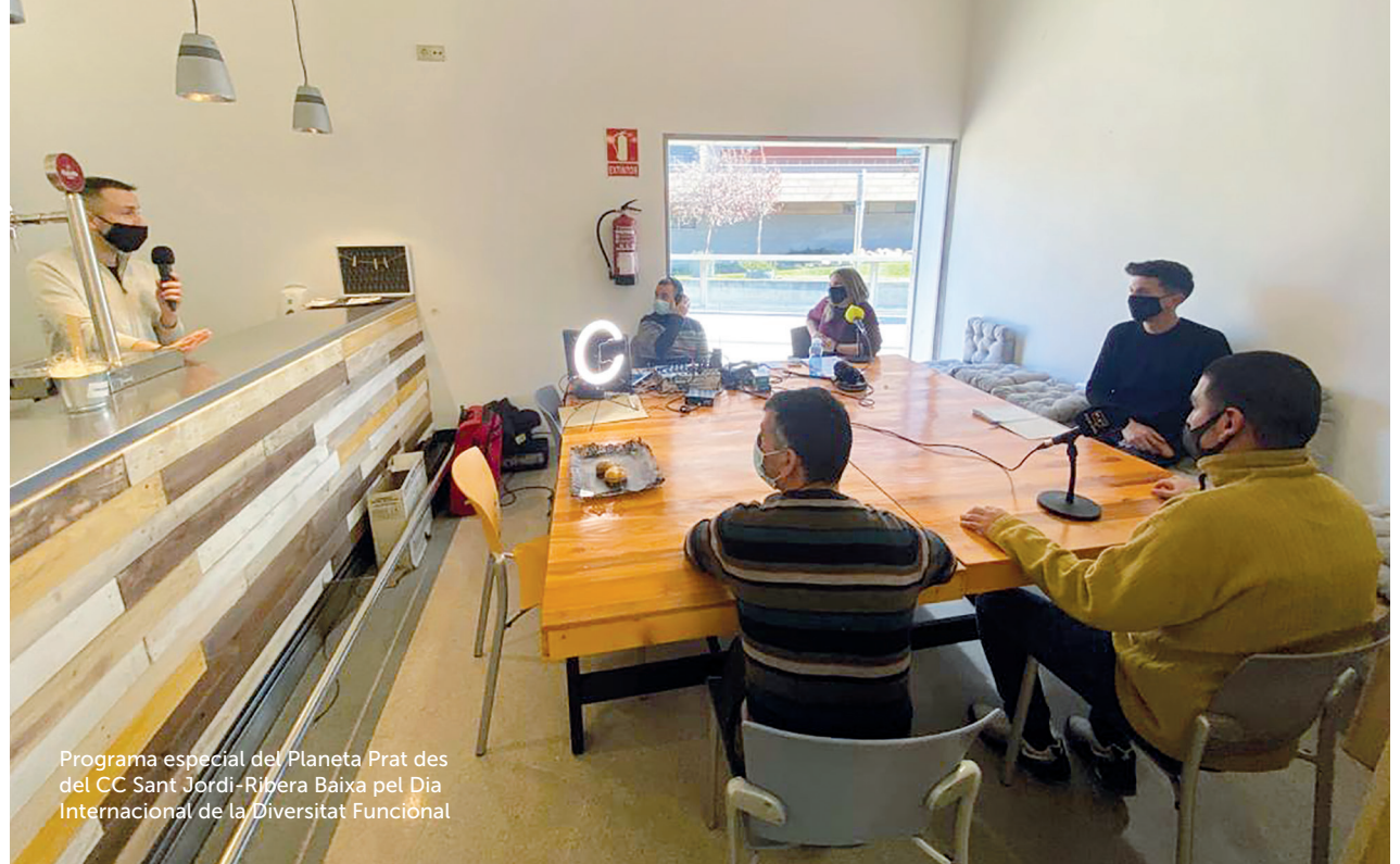
Programa especial del Planeta Prat des del CC Sant Jordi-Ribera Baixa pel Dia Internacional de la Diversitat Funcional

5.2 Impuls de l'audiència digital: 236.178 informacions visitades