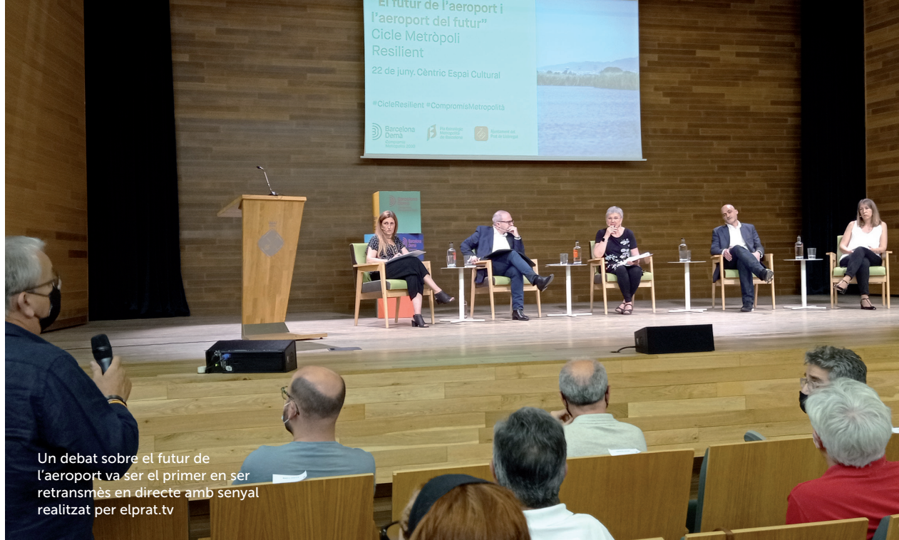
Un debat sobre el futur de l'aeroport va ser el primer en ser retransmès en directe amb senyal realitzat per elprat.tv

El pressupost previst per a l'any 2022 ascendeix a 880.238 euros, el que representa una variació de 2,15 % respecte del que es va pressupostar inicialment per a l'exercici 2021.