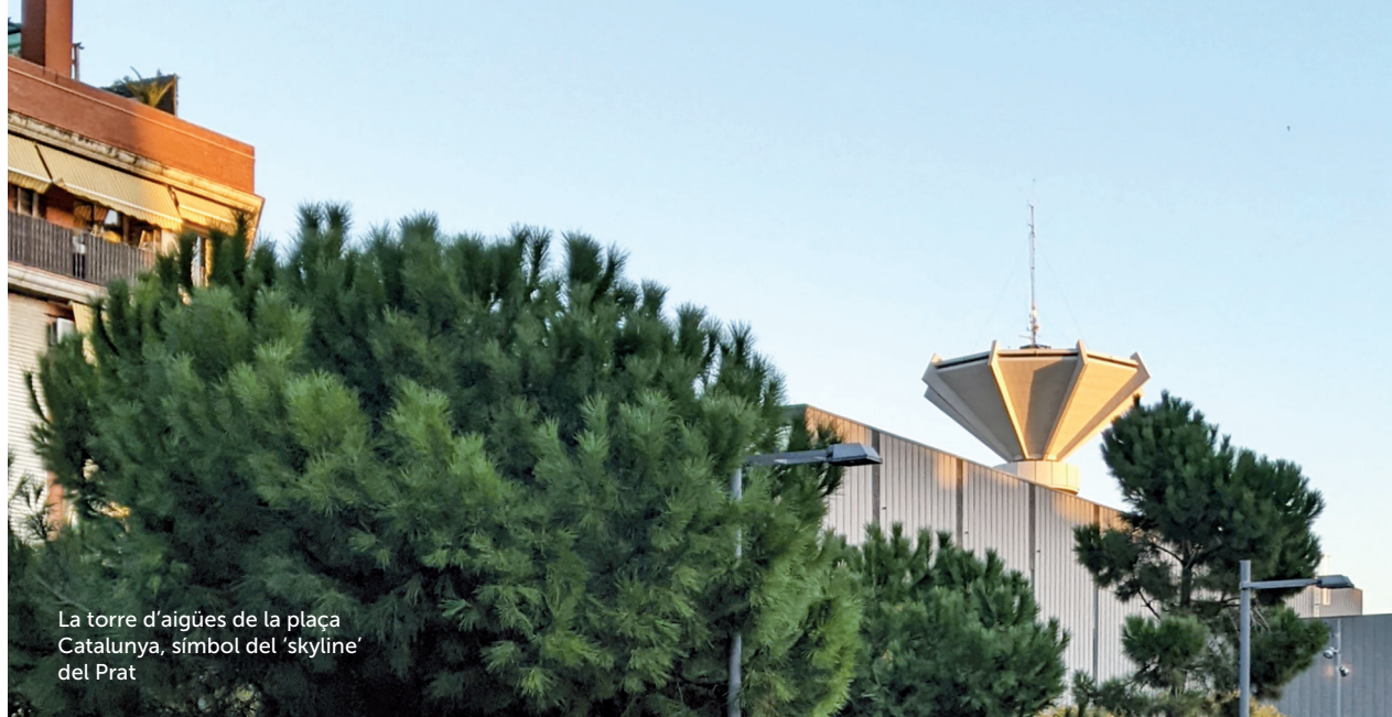
La torre d'aigües de la plaça Catalunya, símbol del 'skyline' del Prat

L'experiència acumulada al llarg dels més de vint anys des de la creació de El Prat Comunicació SL; el seu creixement progressiu i sostingut i, sobretot, la seva vocació proactiva d'oferir un servei informatiu pròxim i de qualitat a la ciutadania pratencs han convergit aquest 2021 en la creació d'un nou mitjà com elprat.digital i en la renovació notable dels diferents espais informatius de la societat, unificats en una plataforma digital única.