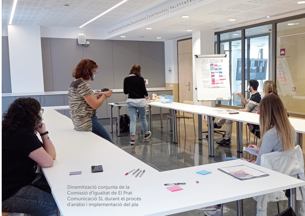
Dinamització conjunta de la Comissió d'Igualtat de El Prat Comunicació SL durant el procés d'anàlisi i implementació del pla

Un dels projectes estratègics de 2021 de El Prat Comunicació SL va ser l'impuls i l'assumpció del compromís d'actuació real amb la igualtat de gènere en proposar-se com a objectiu l'elaboració d'aquest Pla d'Igualtat propi, tot i no ser obligatori per les característiques de l'empresa. Es tracta, però, d'una necessitat real i, per tant, com a empresa pública, entenem que hem de servir d'exemple per a altres petites i mitjanes empreses, que no tinguin aquest espai de reflexió.